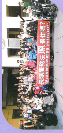
針對身心障礙者討論我國長照制度。會議紀錄本會交由相關部會進行討論

推動社區、住宅、騎樓、大眾交通及醫療院所等公共設施之無障礙環境與資訊。並參與各式符合障礙者需求之長期照顧服務政策。