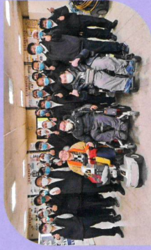
對三重客運司機講授服務身心障礙者教育訓練